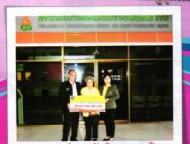
ศูนย์ประสานงานสหกรณ์ออมทรัพย์พระจอมเกล้าพระนครเหนือ