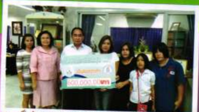
ศูนย์ประสานงานสหกรณ์ออมทรัพย์ข้าราชการสังกัดกระทรวงศึกษาธิการ จ.อุบลราชธานี