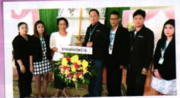
ศูนย์ประสานงานสหกรณ์ออมทรัพย์ครูปัตตานี

สสอ.เป็นองค์กรสวัสดิการมาปบกิจสงเคราะห์ในสหกรณ์ออมทรัพย์กลุ่มวิชาชีพครู กรณีที่ สหกรณ์ออมทรัพย์ต้นสังกัดสมาชิกเป็นศูนย์ประสานงาน เวลาจะสมัคร,ชำระเงินสงเคราะห์ทำ หรือ รับทราบข้อมูลข่าวสารต่างๆของสมาคมสมาชิกก็เดินไปที่สหกรณ์ได้เลย ซึ่งขณะไม่มีสมาชิกอีกมากต้องการสมัคร สสอ.แต่สหกรณ์ต้นสังกัดยังไม่เป็นศูนย์ประสานงาน สสอ.ขอแจ้งให้ทราบว่าท่านสามารถติดต่อสมัครได้ที่ศูนย์ประสานงานในจังหวัดของท่าน จ.นครราชสีมา สมัครได้ที่ ศูนย์ประสานงาน สอ.สามัญศึกษา จังหวัดนครราชสีมา จ.อุบลราชธานี สมัครที่ ศูนย์ประสานงาน สอ.เสนาธรรมจักรอุบลราชธานี จ.อุบลราชธานี สมัครที่ศูนย์ประสานงานสหกรณ์ออมทรัพย์ข้าราชการกระทรวงศึกษาธิการอุบลราชธานี