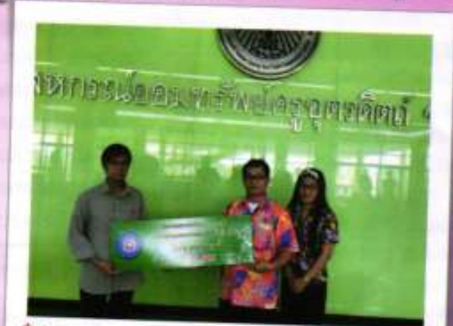
ศูนย์ประสานงานสหกรณ์ออมทรัพย์ครูอุตรดิตถ์